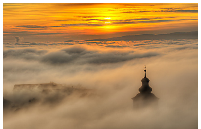
Hochneukirchen im Oktober